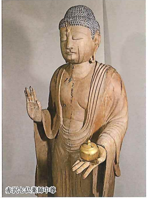
赤沢七仏薬師中尊