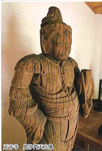
正音寺 毘沙門天立像