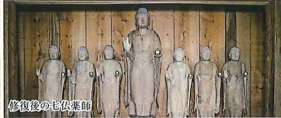
修復後の七仏薬師