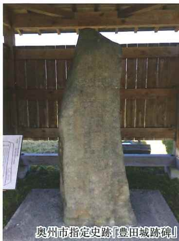
奥州市指定史跡「豊田城跡碑」