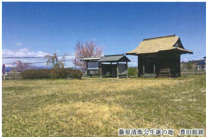
藤原清衡公生誕の地、豊田館跡