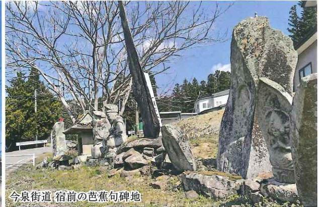
今泉街道 宿前の芭蕉句碑地