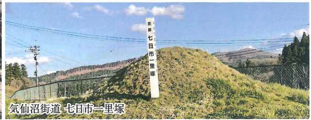
気仙沼街道 七目市一里塚